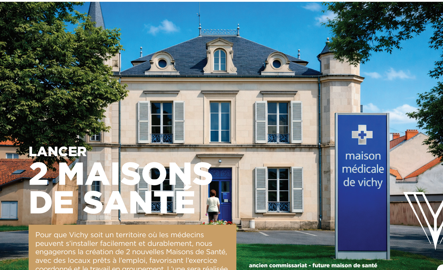
ancien commissariat - future maison de santé

À la fin du mandat, chaque Vichyssois doit pouvoir accéder à un médecin. C'est le fil rouge de notre action. Soigner mieux quand on en a besoin. Prévenir davantage pour rester en bonne santé plus longtemps. Accompagner chacun, à chaque âge de la vie.