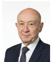
15 - CLAUDE MALHURET Sénateur de l'Allier Ancien Ministre Ancien Maire Médecin 75 ans